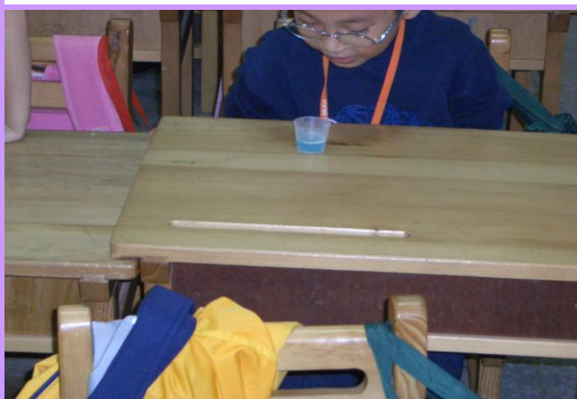
每周二固定實施一週一次含氟漱口保健