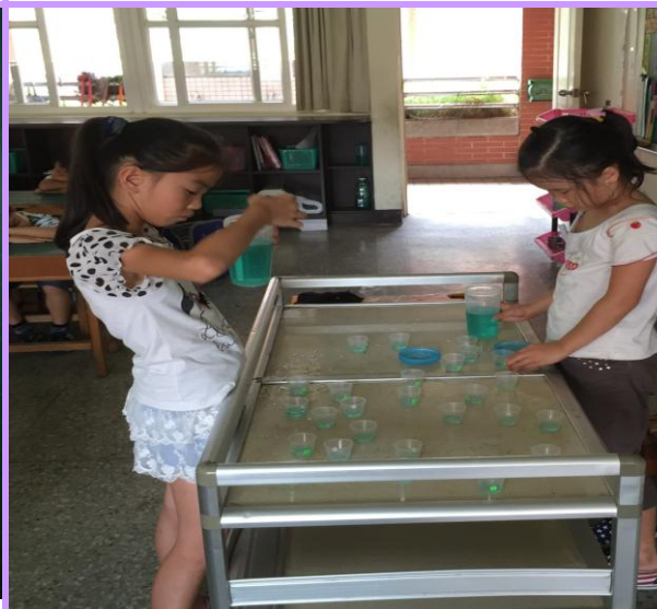
餐後用專屬小牙杯含氟在口中漱漱口