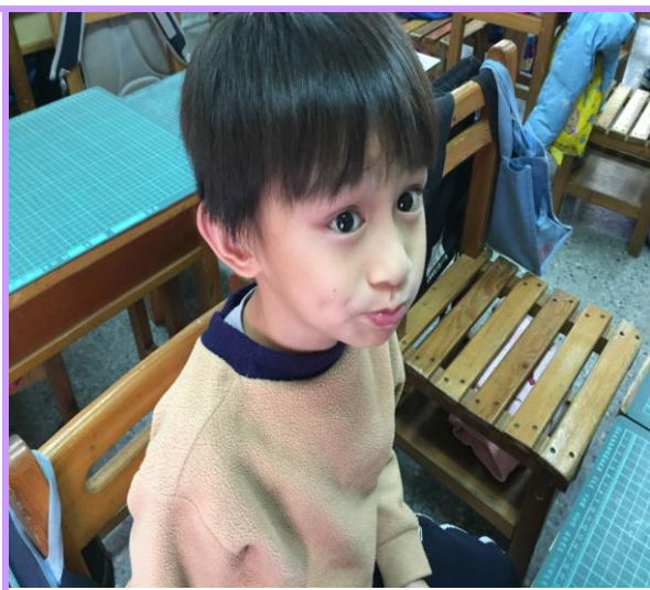
漱口水「上上下下左左右右」保護牙齒